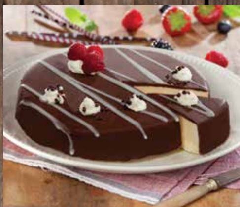
RONDE IJSTAART VANILLE